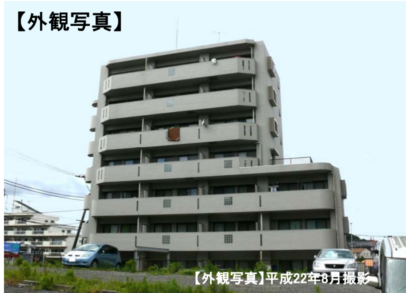
【外観写真】平成22年8月撮影